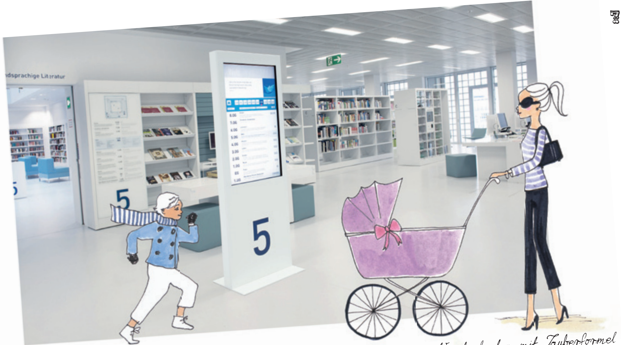
Wunderkasten mit Zauberformel The magic box

Digitale Medien können dem inneren Denker dienlich und zugleich der Intuition in uns Verlockung sein. Als Werbe- oder Informationssysteme senden Stelen wirkungsvolle Kaufanreize, versüßen unterhaltend Wartezeiten, geben wichtige Auskünfte und sind bei Bedarf interaktiv. Digital Signage von netvico ist ebenso in gezielter Mitarbeiterkommunikation ein verlässliches Instrument. Es stimmt den Nutzer positiv ein und erfüllt seinen Zweck überall da, wo es Menschen zu begeistern oder informieren gilt.